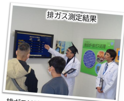
排ガスは適正に処理しているのじゃ！