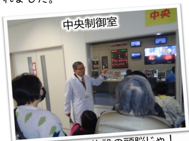
この部屋は施設の頭脳じゃ！

「ごみ処理博士」に扮した職員がユーモアあふれる語り口で参加者へはだのクリーンセンター施設の様子を説明し、ごみクレーンでつかんだごみの重量を予想する賞品付きのクイズを出題するなど、「楽しみながら学ぶ」をコンセプトで行われました。