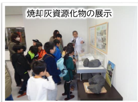
焼却灰はリサイクルできるのじゃ！